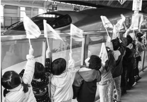
いってらっしゃーい！