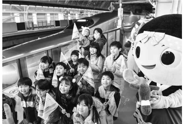
新幹線の前で記念撮影する子どもたち