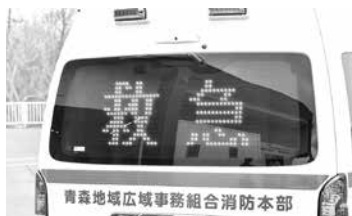
車両後部の電光掲示板