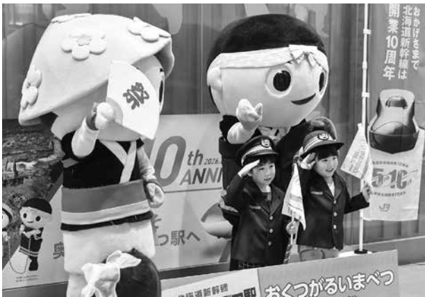
あらまくん・たずなちゃんと一緒に敬礼！