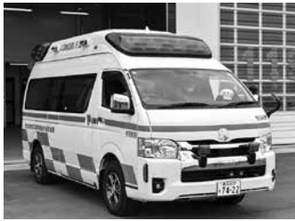
更新された救急車

中央消防署今別分署の救急車が3月30日に更新され、救急活動への対応能力が向上しました。