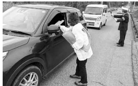
安全運転を呼びかける交通安全母の会の皆さん

4月6日から4月15日まで春の交通安全運動が実施され、6日早朝に特別養護老人ホームなかやま荘前で、安全運転を呼びかける街頭指導が行われました。 参加者は「交通事故に気をつけてください。」と安全運転を呼びかけていました。