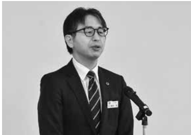
役場職員へ退任の挨拶を述べる飯田副町長