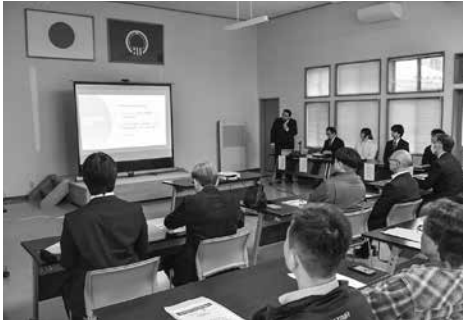
成果報告会の様子

果から、いまべつ牛の認知度の高まりや購入経験者が増加していることがわかっており、今後追い風を生かして積極的なPR活動に取り組んでいきます。