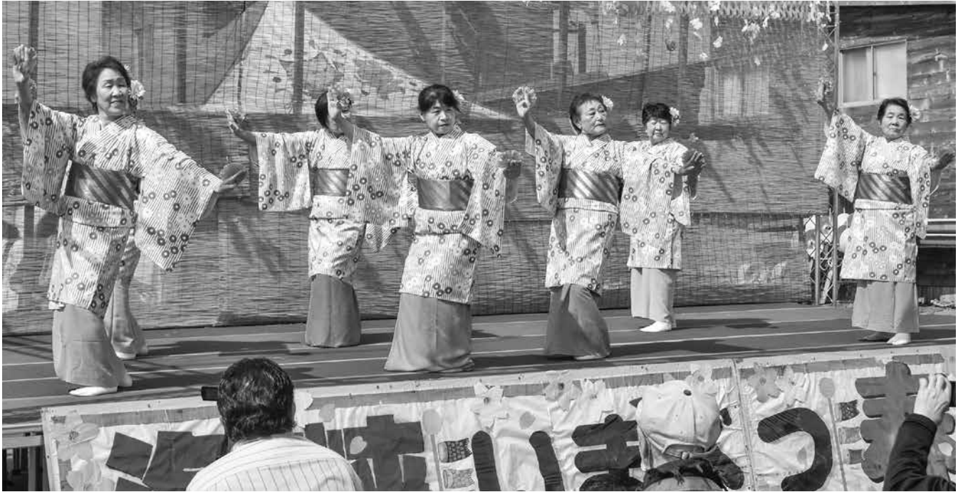
今別町連合婦人会による演舞「あや子のお国自慢だよ」