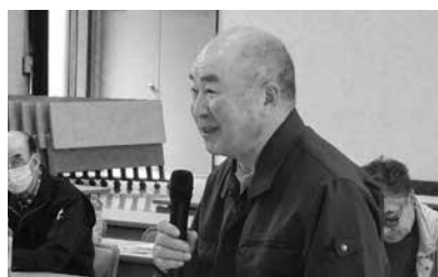
町への意見・要望を述べた出席者