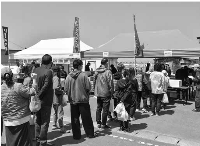
地場製品の販売も行われ長蛇の列ができました