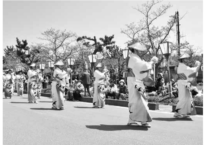
オープニングを飾ったのは流し踊り「今別おけさ」