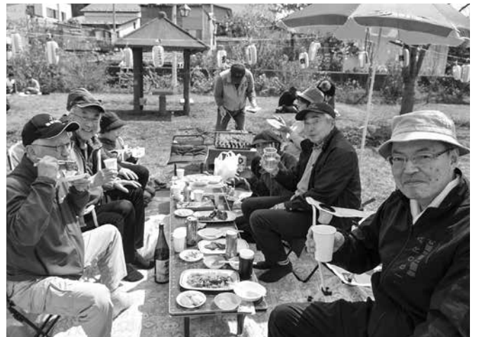
おいしいお酒においしい料理。最高ですねっ♪