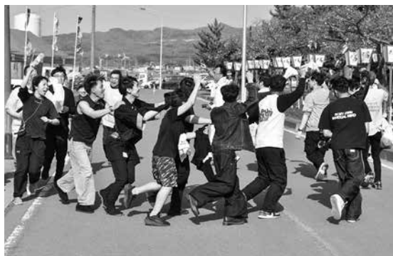
ライブで大熱狂！みんなで輪になってグルグル