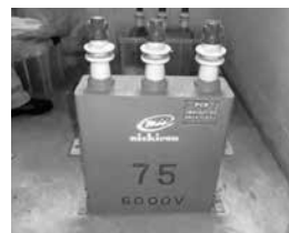
電力用コンデンサー