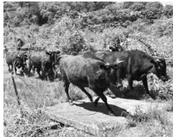
一斉に走り出す牛たち