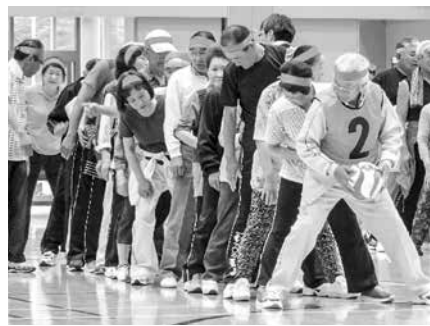
▶ボール送り競技に出場する今別町チームのみなさん