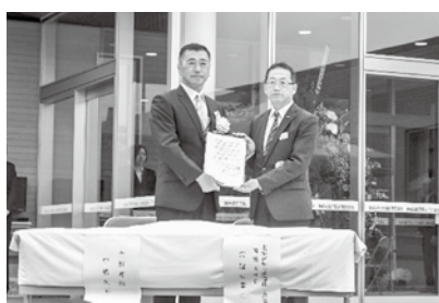
▶JR北海道と協定を締結