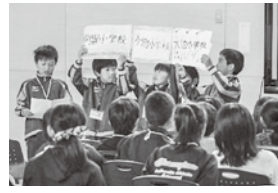
▲学校紹介する児童たち