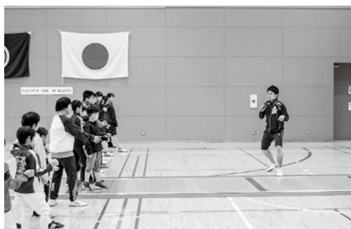
▲世界の技術を学んだフェンシング教室