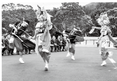
▶二股荒馬が花を添える

式典では、建設工事に携わった関係者に感謝状を贈ったほか、町がJR北海道と連携し新幹線の災害時等の避難場所としても活用するための協定締結式も行われました。