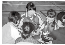
▲仲間ができました

到着後、知内小学校の児童に温かく迎えられ、学校の紹介をしたり、一緒に給食を食べる等、楽しい時間を過ごし、たくさんの方達と交流することができました。