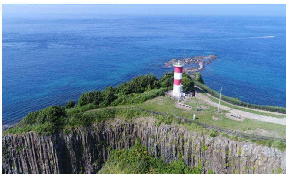
ほろづき たかのさき 【写真：津軽国定公園 袈月海岸高野崎】