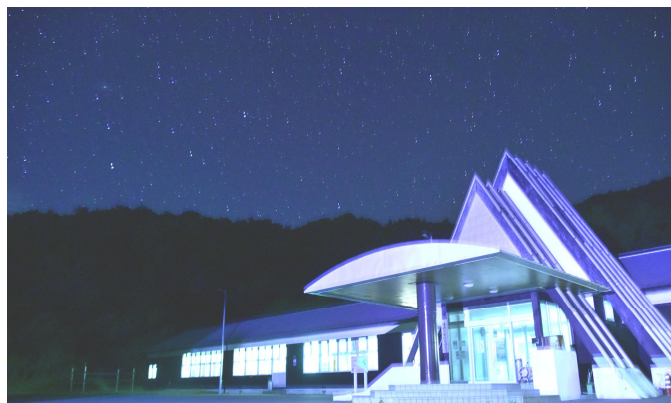
【写真：海峡の家 ほろづき】

・採用後、日々の勤務状況を確認するために、別添「活動記録簿」に月ごとの活動内容や勤務時間等を記載し、当該月の翌月の7日までに今別町役場の担当課長に提出