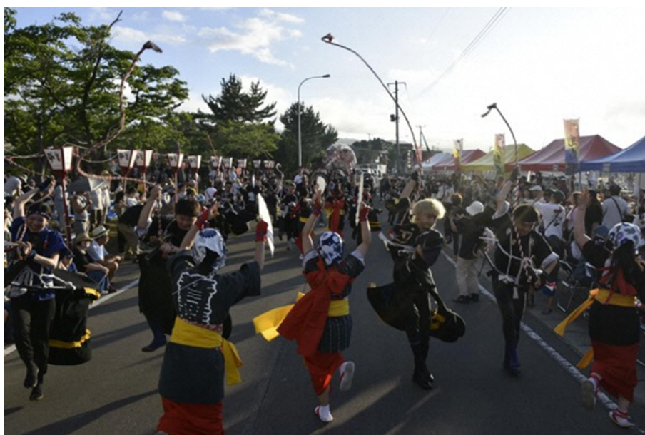
あらかま 【写真：荒馬まつりのようす】

津軽半島の“さきっちょ”で 私たちと「〇〇を目指したまちづくり」に挑戦しませんか？