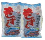
エメラルドもずくなどの加工品も販売されています

問 今別町商工会 電 0174-35-2014 営 9:00~14:00 ※5/3~10/31(土日休) 冬期間休業(要電話確認)