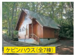
ケビンハウス(全7棟)