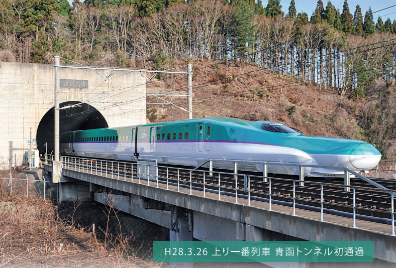
H28.3.26 上り一列車 青函トンネル初通過