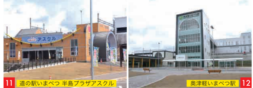
11 道の駅いまべつ 半島プラザアスクル