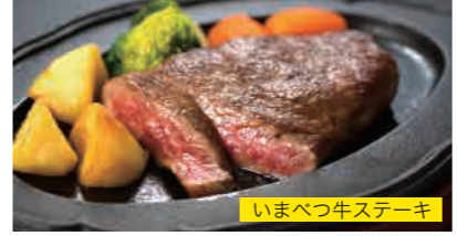
いまべつ牛ステーキ

津軽線「津軽二股駅」に隣接している、今別町の観光情報が手に入る奥津軽の観光拠点。特産品やおみやげを買うことができるだけでなく、今別町特産の「もずくうどん」や「いまべつ牛」を食べることのできるレストランがあります。