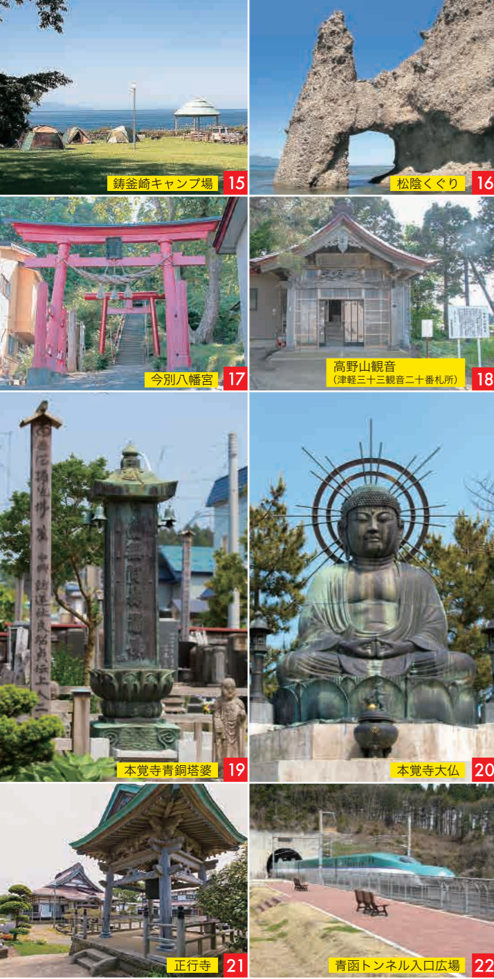
15 鑄釜崎キャンプ場