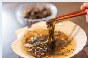
今別町の岩もずくしゃぶしゃぶ