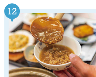
20 カワラケツメイ茶粥 【野辺地町】 要予約

北前船が運んだ上方の茶粥文化がここ野辺地でガラバコス化！「カワラケツメイ茶粥」の滋味深い味わいを堪能！