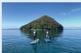
青森市内のビーチでSUP体験