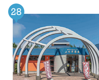
24 ふれあいセンターよもぎ温泉 【蓬田村】 予約不要

抗菌効果・リラックス効果のある青森ヒバの木を全面に貼ったサウナで、森の香りに包まれて身体を整える！