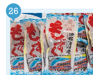
22 半島ぶらざアスクル 【今別町】 予約不要

今別町大川平清川187-16 (道の駅いまべつ半島プラザアスクル) 0174-31-5200