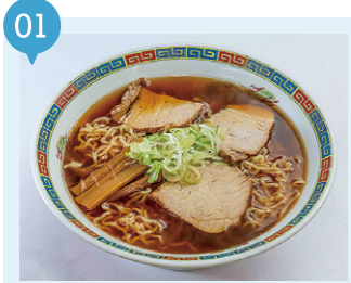
01 (朝の) 煮干しラーメン 【青森市】 予約不要

「食料調達」や「食材ハンティング」を意味する「フォラージュ (forage)」。 食材だけでなく、その土地の食にまつわる知恵や習慣などの食文化まで調達 (フォラージュ) すれば、きっと旅先を今までよりもっと身近に感じられるはず。