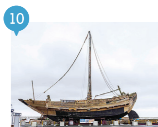
18 復元北前型舟才船みちのく丸 【野辺地町】 予約不要

野辺地町内の北前船の名残を訪ねるプチ探検。みちのく丸⇒常夜燈⇒野辺地八幡宮⇒旧野村家住宅離れ⇒野辺地町立歴史民俗資料館