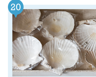
08 風のまち交流プラザ・トップマスト 【外ヶ浜町】 予約不要

施設内の売店では、運がよければ鍋代わりに使える巨大ホタテ貝殻が店頭に並ぶことも！※フェリー乗船には予約が必要です。