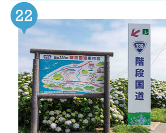
14 階段国道 【外ヶ浜町】 予約不要

あの名曲「津軽海峡・冬景色」の歌詞をリアルに体験できるまたとない機会です (笑) 強風も名物ですよ！