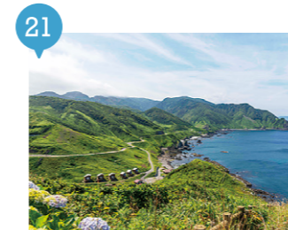
13 龍飛崎 【外ヶ浜町】 予約不要

あの名曲「津軽海峡・冬景色」の歌詞をリアルに体験できるまたとない機会です (笑) 強風も名物ですよ！