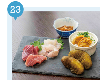
15 津軽海峡の料理 【外ヶ浜町】 要予約

…だって階段なんだから。日本で唯一！自動車を通れない国道「階段国道339号」でインスタ映え！