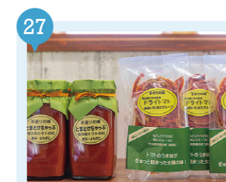
23 マルシェよもぎた 【蓬田村】 予約不要

蓬田村産のトマトで手作りしたケチャップを使ったオムライスを堪能！ドライトマトも有名です。