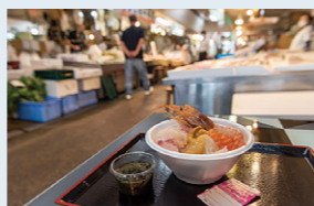
青森市の「のっけ井」を堪能