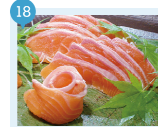
06 北彩屋 (または大畑漁港魚市場) 【むつ市】 予約不要

お刺身、ディール風味のマリネ、生ハム仕立てなど、美味しく加工された下北名物の「海峡サーモン」をゲット。