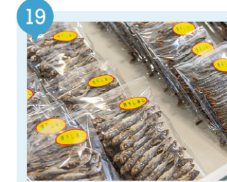
07 脇野沢流通センター 【むつ市】 予約不要

【北彩屋】 むつ市大畑町上野152-2 0175-31-1868 【大畑漁港魚市場】 むつ市大畑町湊村195-2 0175-34-4291