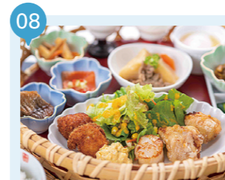
12 ご当地レストランホタテ一番 【平内町】 予約不要

青森市新町2-2-11 東奥日報新町ビル New's 2F 017-764-0220