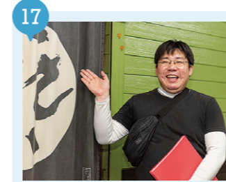
05 田名部まちあるき 【むつ市】 要予約

専属ガイドが案内してくれる、むつ市内のまちあるきコンテンツ。港町ならではの飲食・吞兵衛文化の体験が面白い！