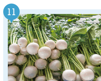
19 ゆうき青森農業協同組合 野辺地支所 【野辺地町】 予約不要

野辺地町野辺地471 (常夜燈公園内) 0175-64-2111 (野辺地町地域戦略課)