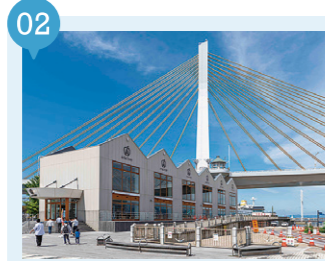
02 A-FACTORY 【青森市】 予約不要

煮干しラーメンで「朝ラー」体験。ラーメン王国青森県では、朝食にラーメンを食べる習慣は超デフォルト。