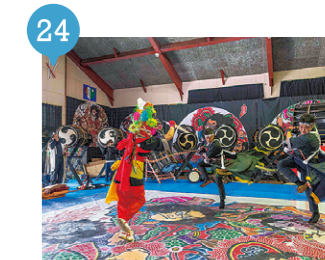
16 荒馬の里資料館 【今別町】 要予約

実際に祭で使用している大川平地区の太鼓、ねぶた、荒馬を見学。※見学の際には事前に連絡が必要です。