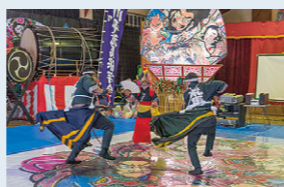
今別町の「荒馬」体験