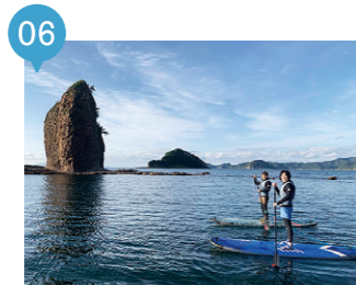
10 サンセットビーチあさむし 【青森市】 要予約

SUP体験。豊富な魚介類を育むむつ湾の環境を身体的に体感すべく、SUPでむつ湾の「海面」を体験します！