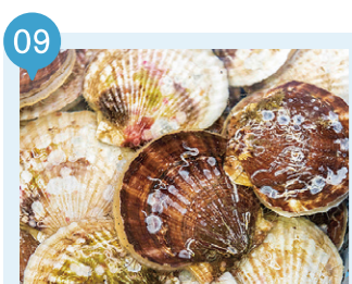
17 ほたて広場 【平内町】 予約不要

むつ湾を取り囲む緑豊かな山々から流れ入る栄養豊富な水で育った甘味があるほたては真剣に美味！