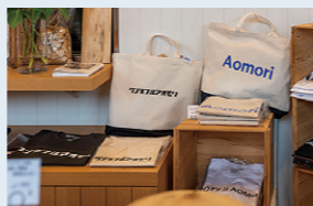
青森市の「A-FACTORY」でお買い物