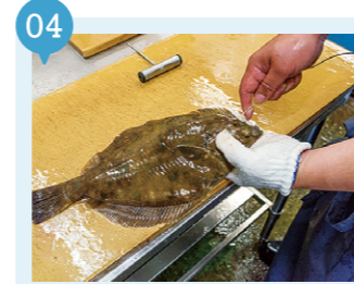
04 塩谷魚店 【青森市】 要予約