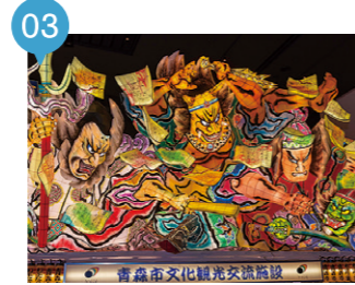
03 ねぶたの家 ワ・ラッセ 【青森市】 予約不要