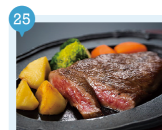
21 レストラン驛 【今別町】 予約不要

銘柄牛「いまべつ牛」。奥津軽いまべつ駅に隣接する「半島ぶらざアスクル」ではステーキで味わえます。