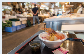
尽享青森市“自选海鲜盖饭Nokke-don”